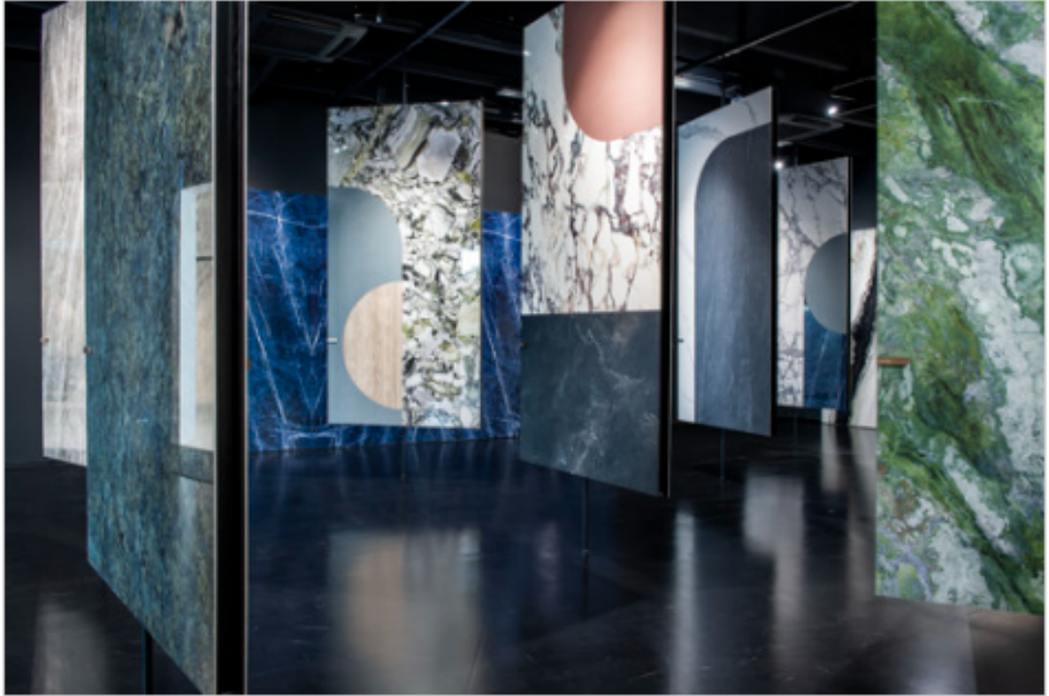
Showroom FAB Fiandre Architectural Bureau