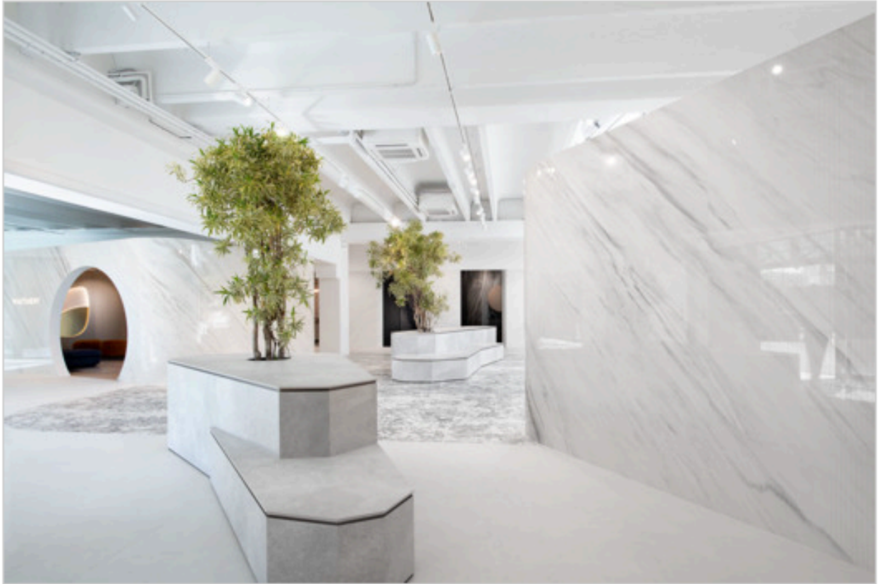
Showroom FAB Fiandre Architectural Bureau