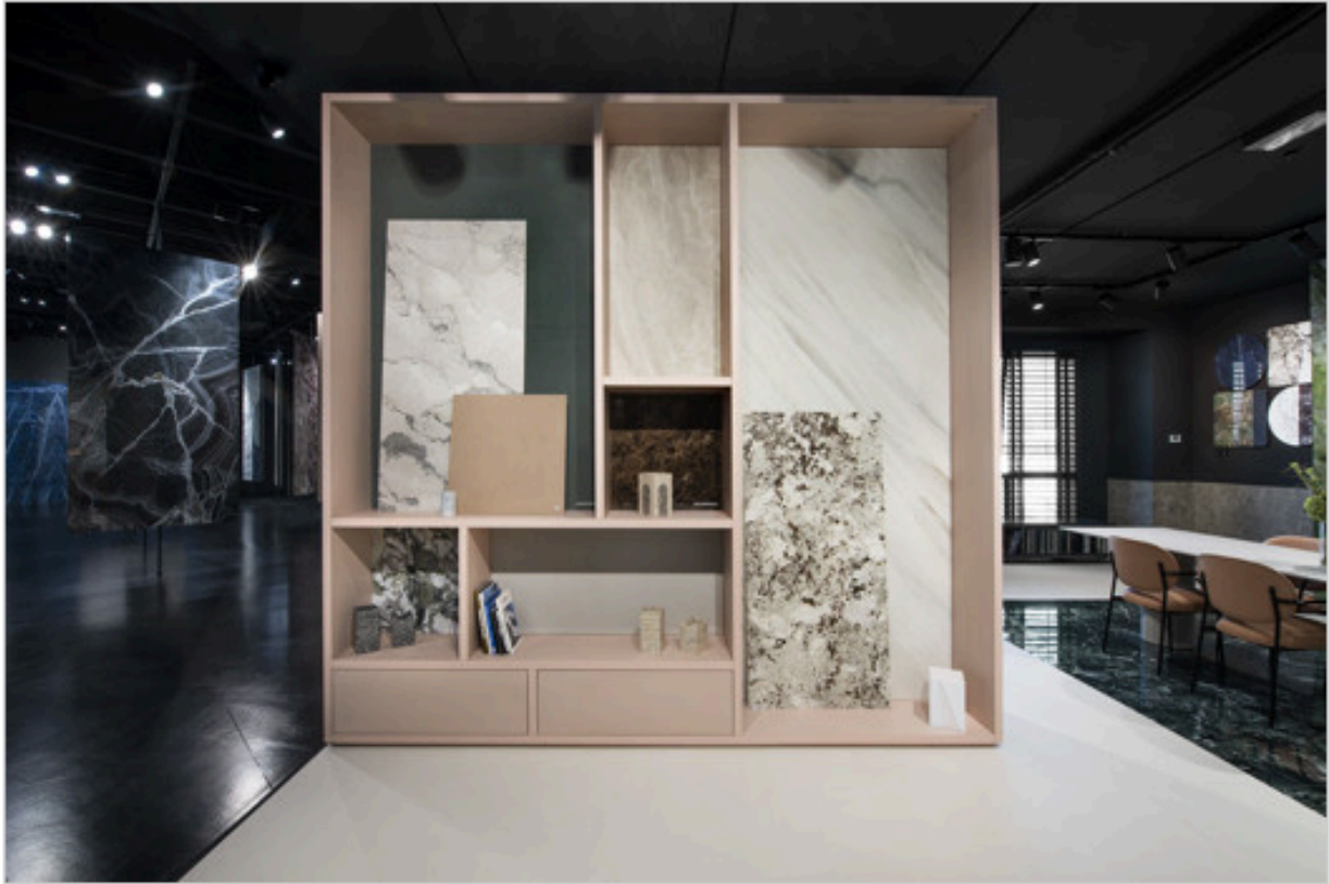
Showroom FAB Fiandre Architectural Bureau - photo Giancarlo Pradelli