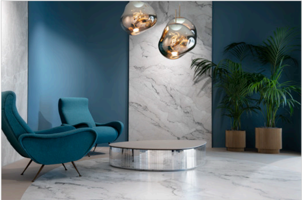
Showroom FAB Fiandre Architectural Bureau