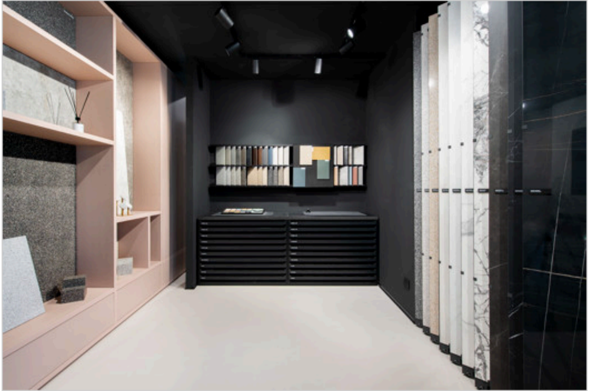
Showroom FAB Fiandre Architectural Bureau