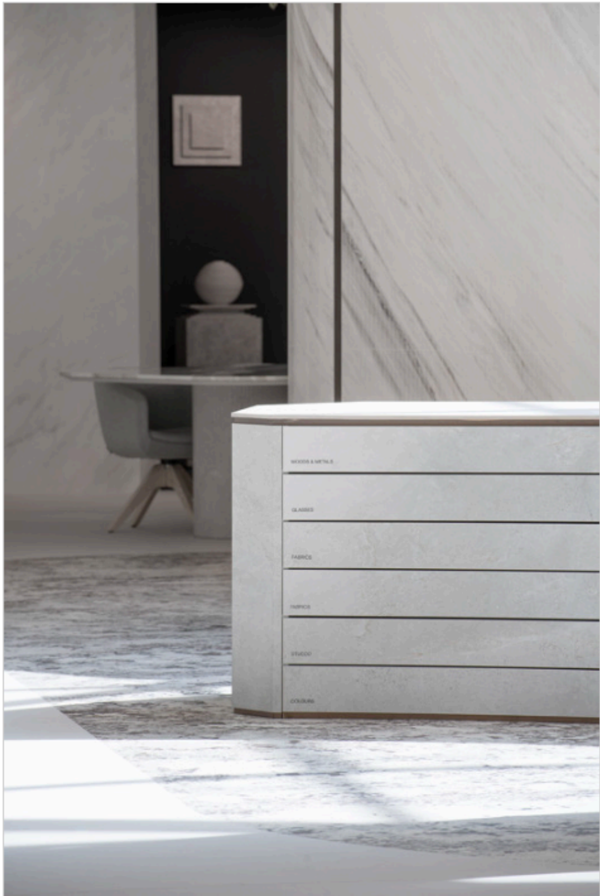
Showroom FAB Fiandre Architectural Bureau