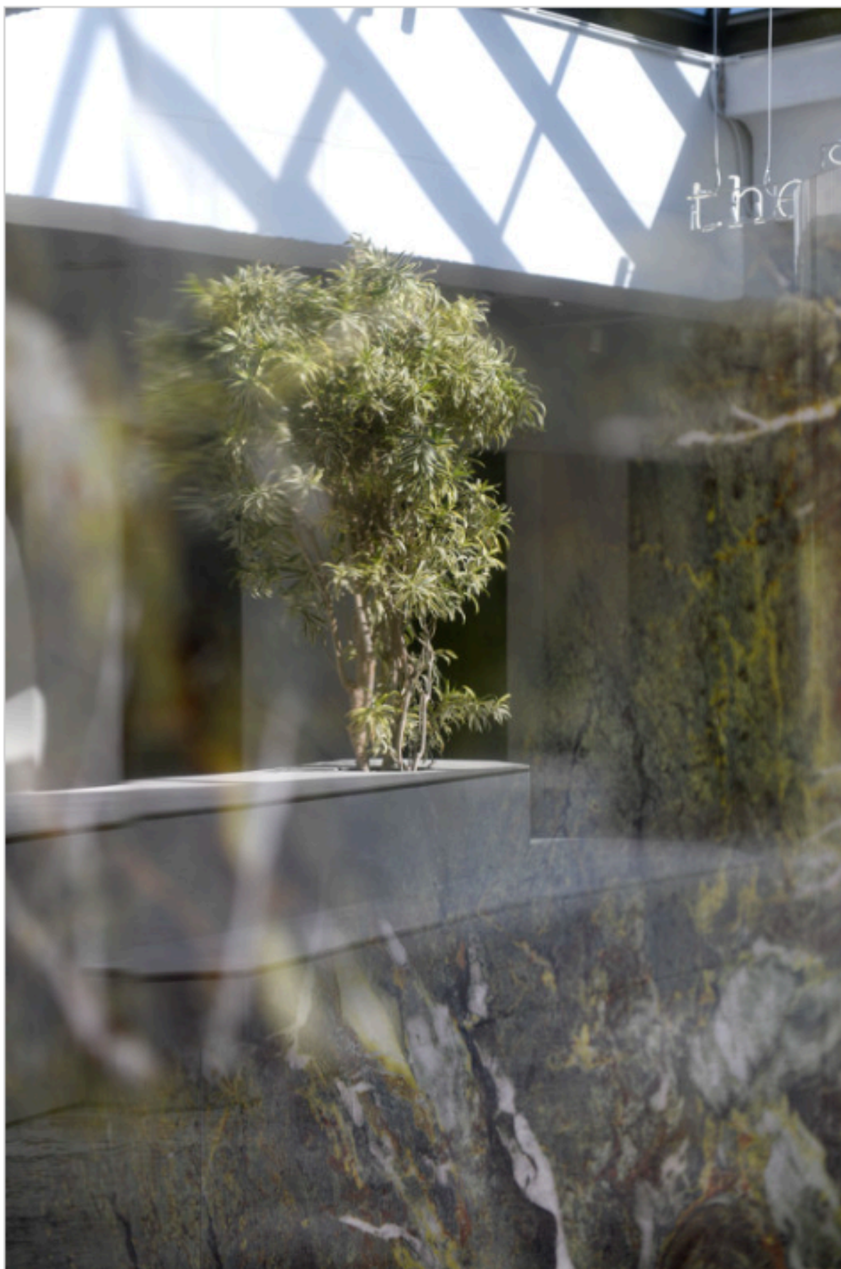
Showroom FAB Fiandre Architectural Bureau