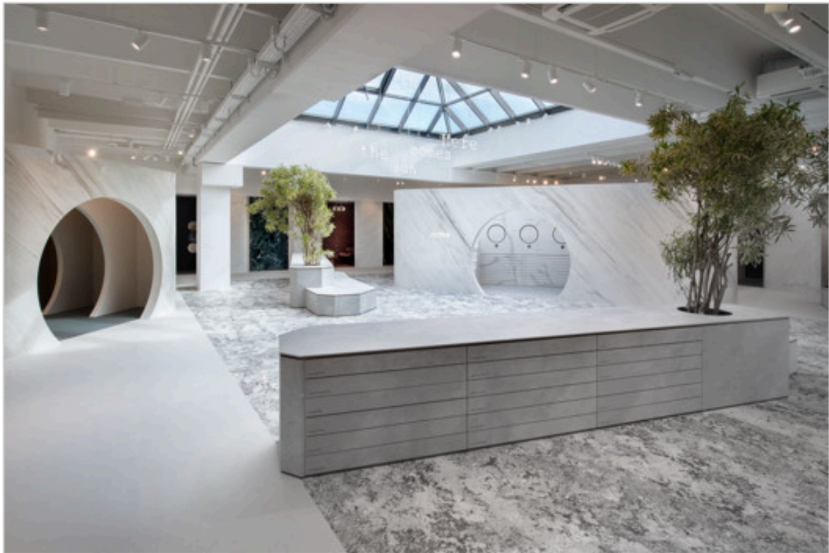
Showroom FAB Fiandre Architectural Bureau