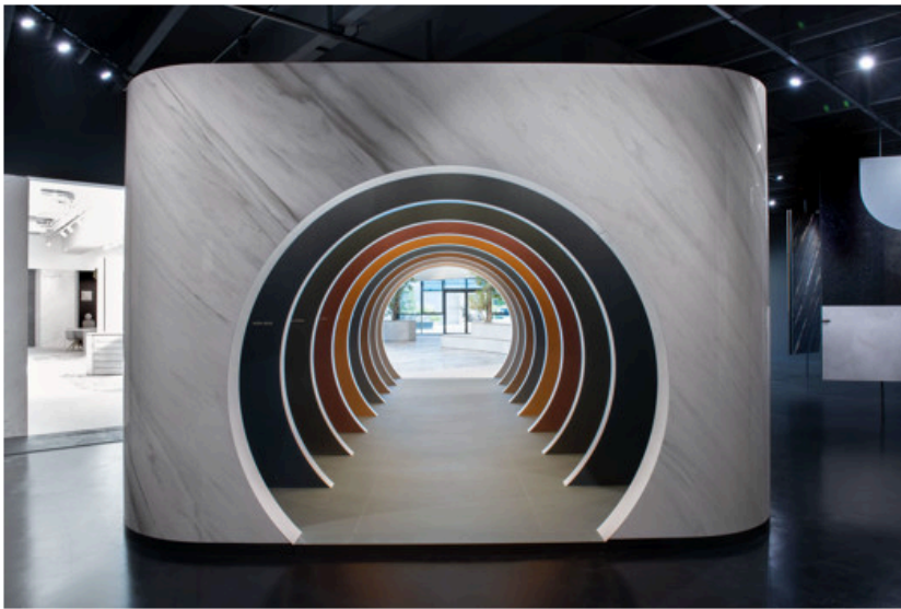
Showroom FAB Fiandre Architectural Bureau