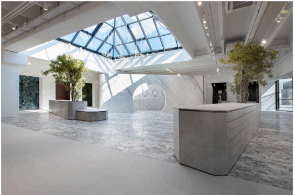
Showroom FAB Fiandre Architectural Bureau