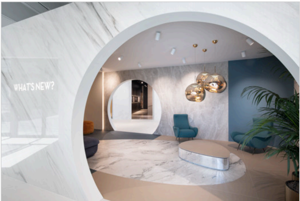
Showroom FAB Fiandre Architectural Bureau