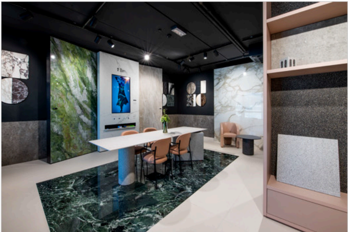
Showroom FAB Fiandre Architectural Bureau